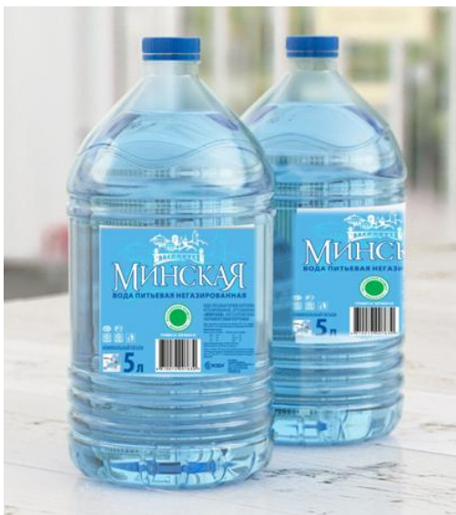
Формат 3 и 5 л