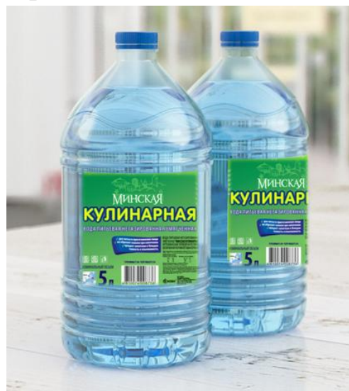
Формат 3 и 5 л